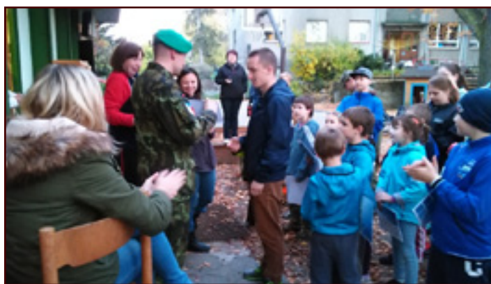
Zborovský závod zdatnosti.