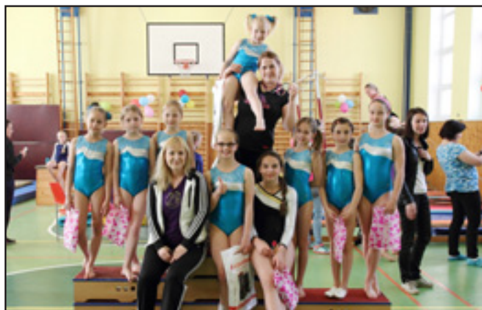
Gymnastky oddílu sportovní gymnastiky TJ Sokol Vsetín ze závodu Rožnovský pohár 2015