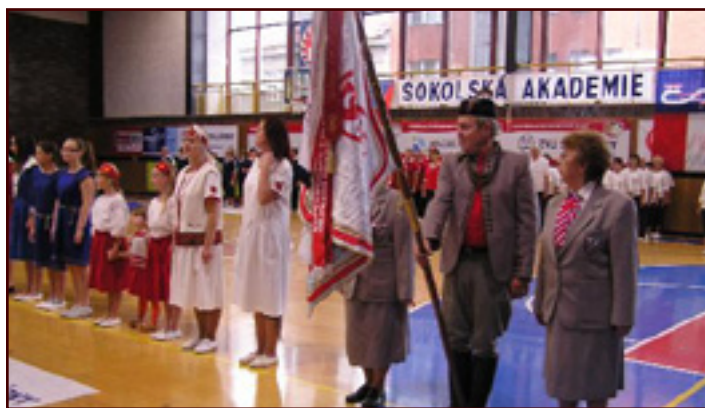
Akademie Župy Orlické v Hradci Králové.