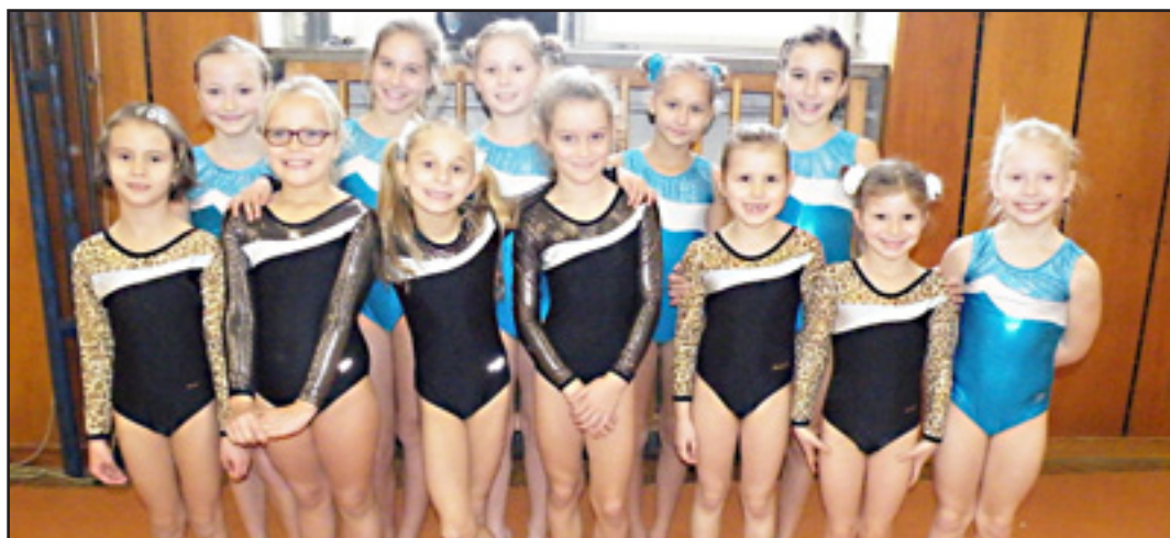
Gymnastky oddílu sportovní gymnastiky TJ Sokol Vsetín ze závodu Vsetínská kladinka